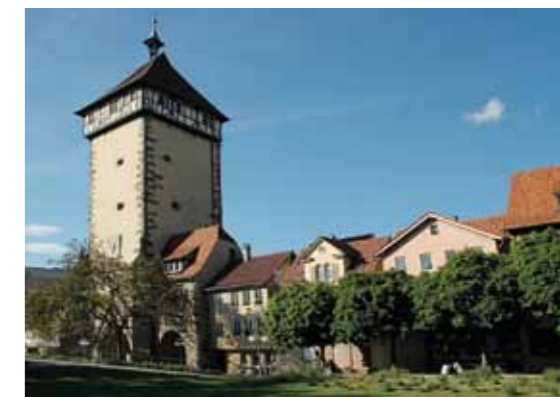
Avantgarde trifft Geschichte: Die Stadthalle bildet mit ihrem klar strukturierten Äußeren einen spannenden Kontrast zum Wachsturm der mittelalterlichen Befestigungsanlage – dem „Tübinger Tor“.

Ob kleine Besprechung oder Großveranstaltung: Aktuelle Präsentations- und Bühnentechnik, äußerst variable Flächen- und Raumkonzepte, freundliches sowie geschultes Personal und exzellente Gastronomie werden Sie drinnen verwöhnen. Und draußen? Unsere umlaufende und ebenfalls buchbare Terrasse im 3. Obergeschoss bietet Ihnen interessante Ausblicke auf die Reutlinger Altstadt.